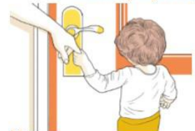
Нет указательного жеста