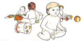
Не интересуется детьми