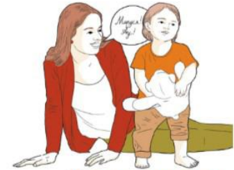
Не реагирует на имя