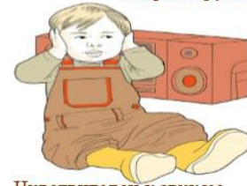
Чувствителен к звукам